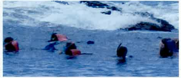
8月20日(土) 「シュノーケリング体験教室」