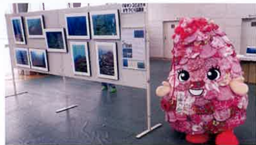
11月20日(日) 「牟岐町にぎわい産業祭」