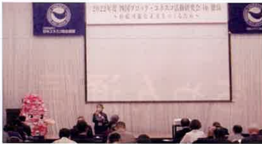
10月30日(日) 「四国ブロック・ユネスコ活動研究会 in 徳島」