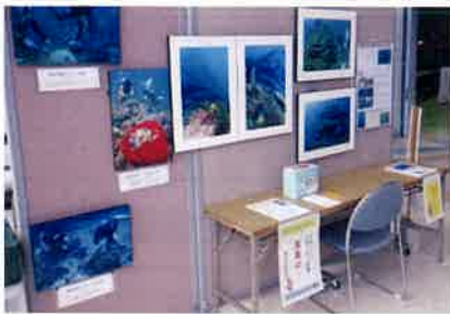
11月26日(土) 「青少年のための科学の祭典 徳島大会」