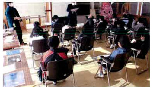
1月26日(木) 牟岐小学校3年生「総合的な学習の時間」

詳しくは、協議会HP https://www.sennensango.com をご覧ください。