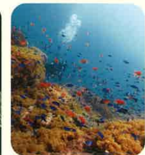
キンギョハナダイ、ソラスズメダイ